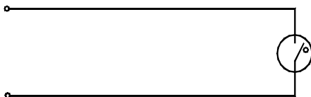
СХЕМА ЭЛЕКТРИЧЕСКАЯ ПРИНЦИПИАЛЬНАЯ