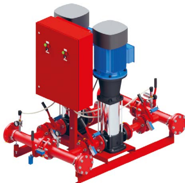
Автоматизированная установка пожаротушения «Пульсар»